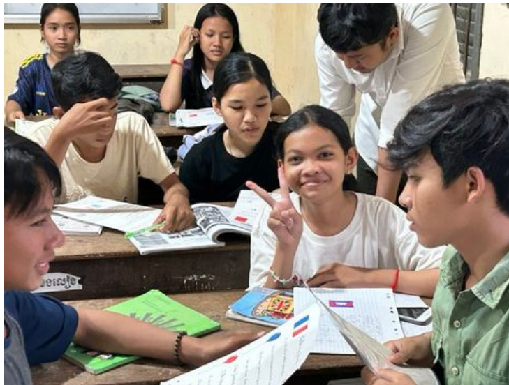
Les élèves découvrent les lettres envoyées par les jeunes français.